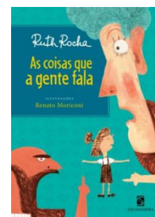
Histórias que a gente fala - Valore Autor: Rute Rocha